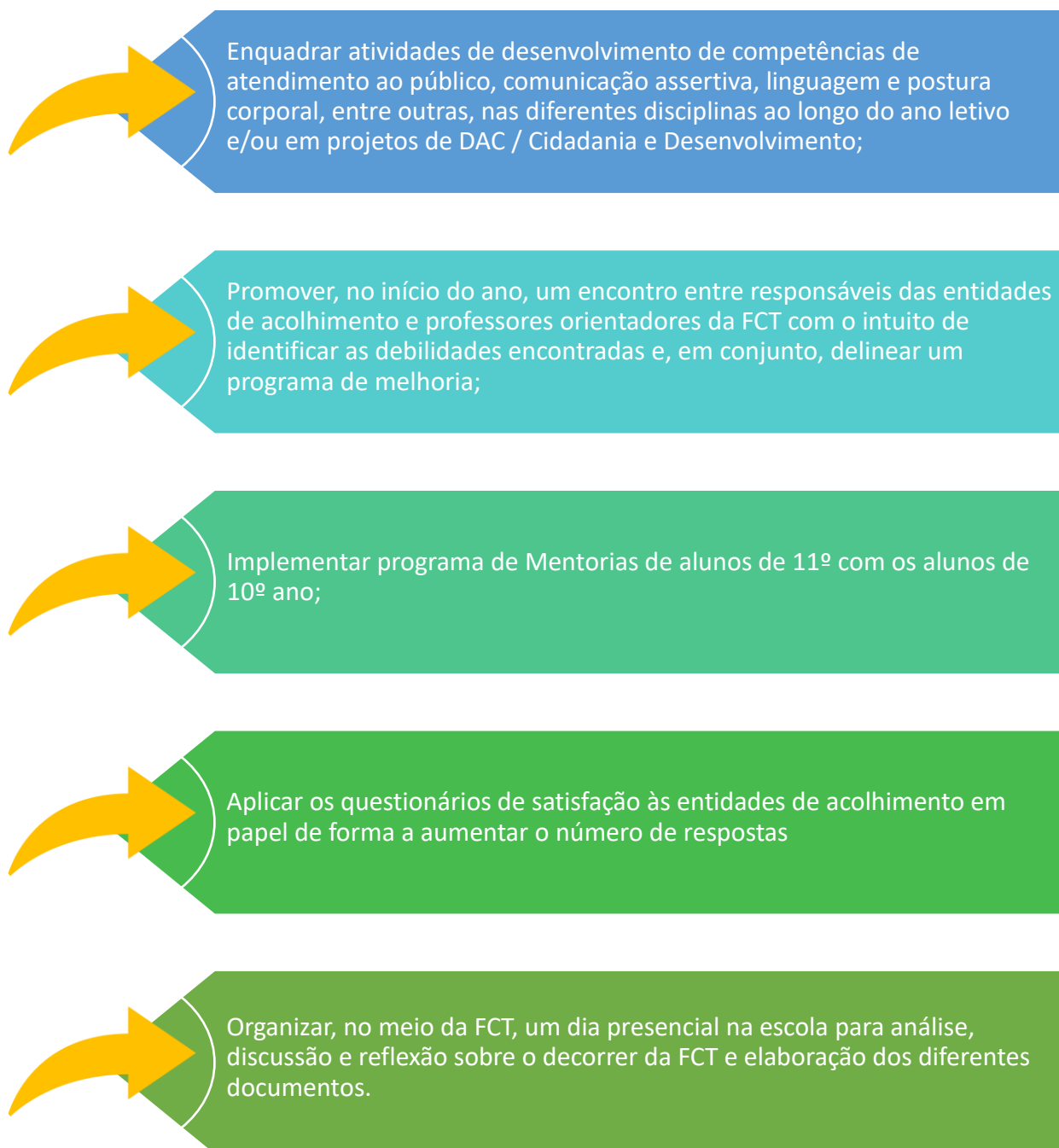
Imagem n.º 5 - Ações de melhoria a implementar no próximo ano letivo

No próximo ano letivo, no seguimento da análise dos resultados obtidos sugerem-se as ações de melhoria que se podem observar na imagem n.º 5.